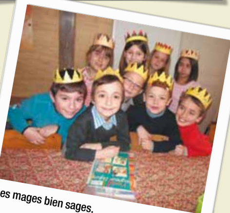
Des mages bien sages.