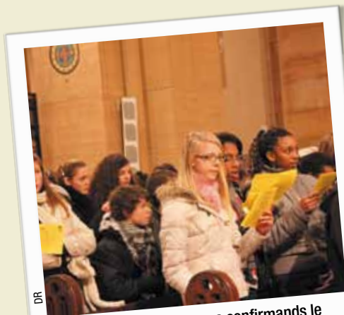
Rassemblement des jeunes confirmands le 14 janvier 2012.