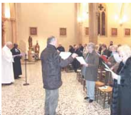
La paroisse catholique accueille les frères et sœurs protestants à l'occasion de la semaine de prière pour l'unité des chrétiens.